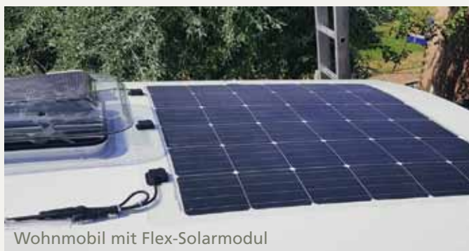
Wohnmobil mit Flex-Solarmodul